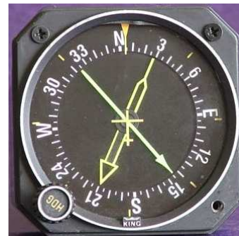
Cet indicateur donne les directions de 2 balises différentes.