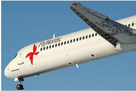
Becs (bord d'attaque)