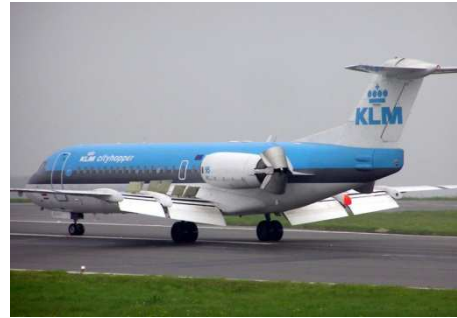
Volets (bord de fuite)

Ils permettent de voler à basse vitesse pour les besoins de l'atterrissage et du décollage. Pour maintenir la portance constante, la diminution de vitesse est compensée par une augmentation de la surface alaire et/ou une augmentation de la courbure (modification de C_x et C_z ).